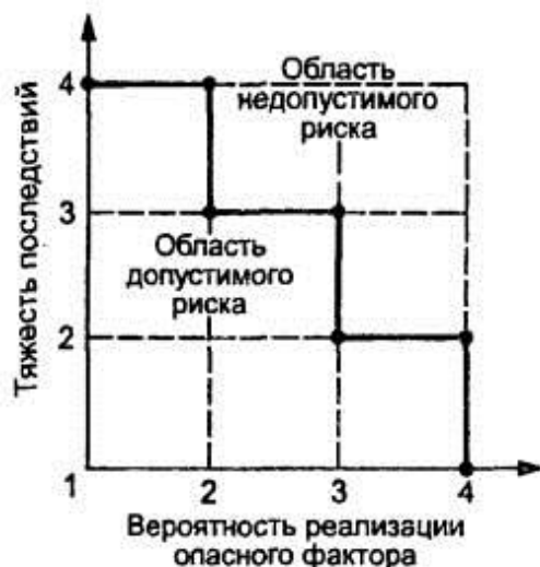
Рисунок Б.1 - Диаграмма анализа рисков

Если точка лежит на или выше границы - фактор учитывают, если ниже - не учитывают.